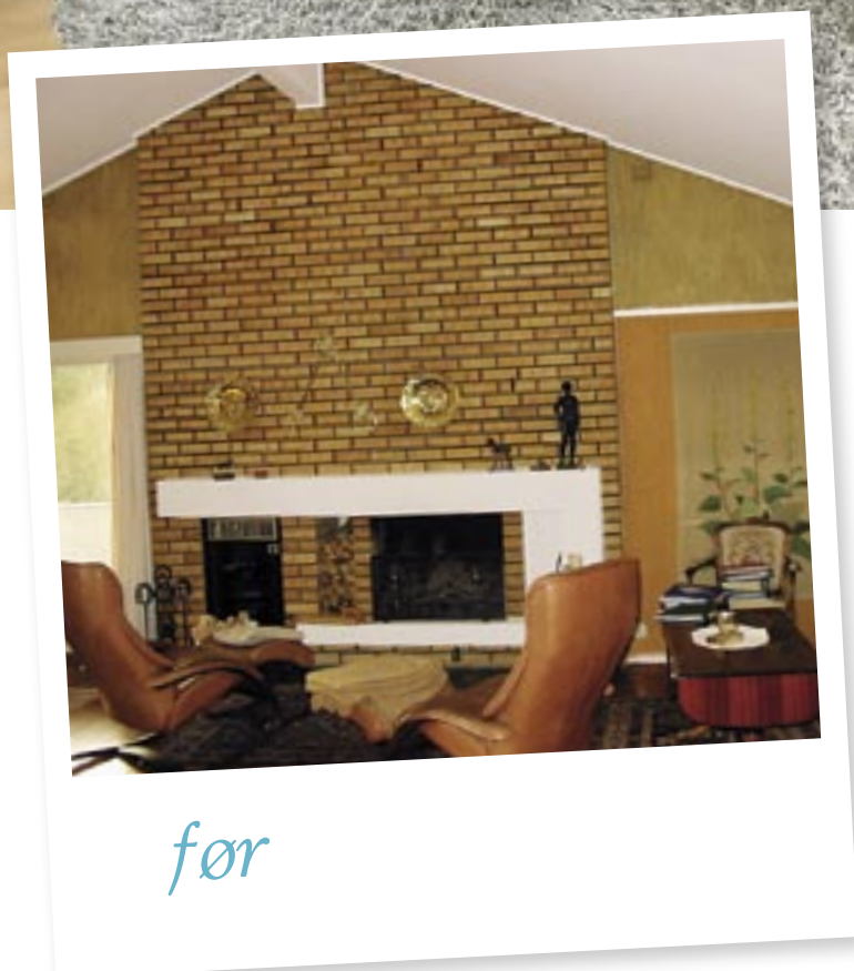
▲ Et stort teppe fra Kasthall samler sittegruppen foran peisen. Sofaer fra Tannum og bord fra Blåmann.